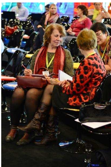
Lahenduste päev 23. Aprillil

2015. aasta lõpu seisuga loodi veebilahenduse funktsionaalsused, keskkond valmib 2016.