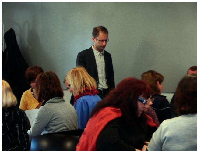
Vabaühenduste raportite koostamise juhendamine Pärnus