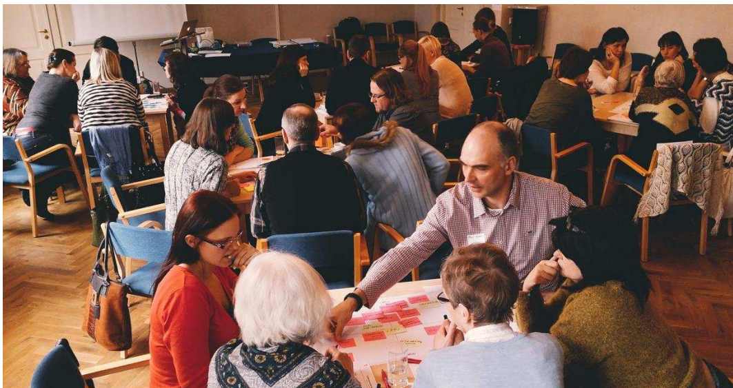
Teenusedisaini rühma töötoad