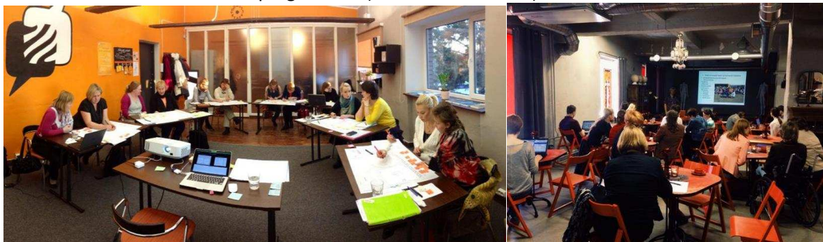
Vabatahtlike arenguprogrammi töötuba ning lõpusündmus