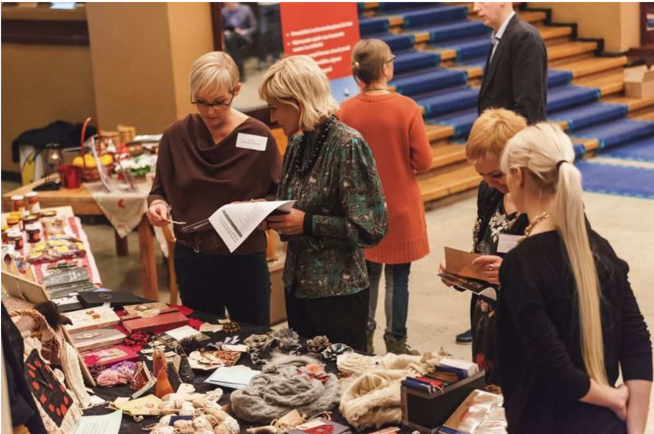
Sotsiaalsete ettevõtete laot Riigikogus